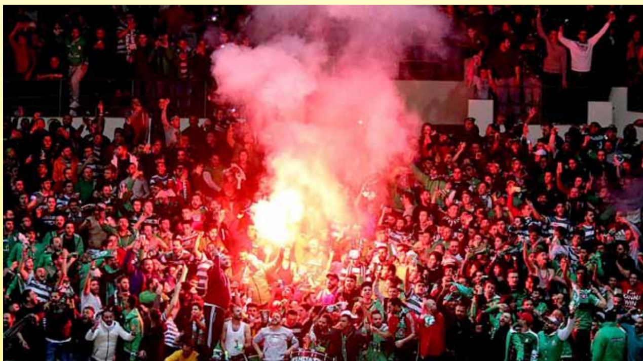
جماهير الوحدات استحق أن تفرح بعد موسم استثنائي