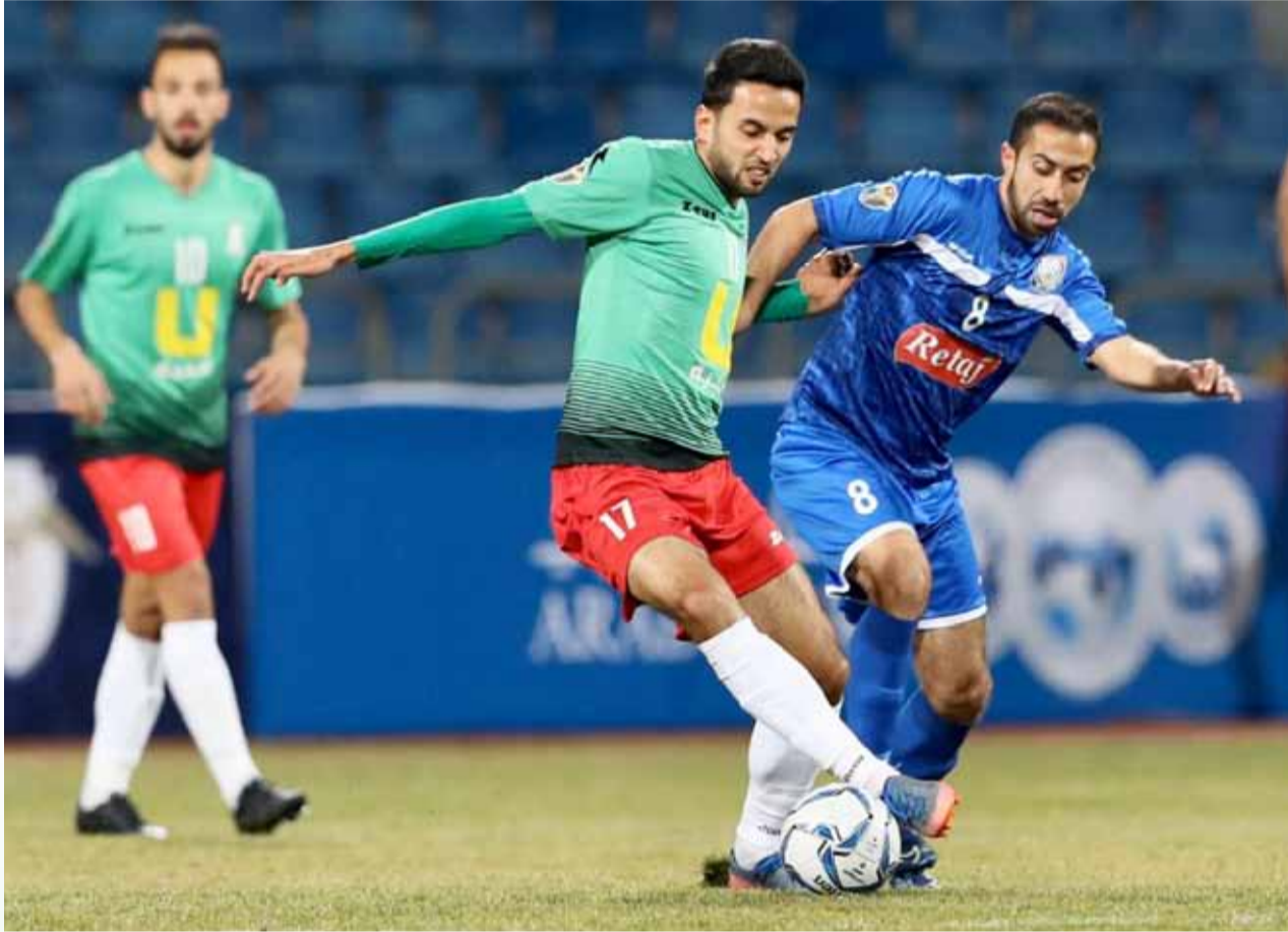
جانب من مباراة الوحدات وسحاب

يبدو أن هناك أندية كبيرة ستخرج مبكرًا من بطولة درع الاتحاد، وهناك تفاؤل بظهور أندية تتأهل للمرة الأولى إلى المربع الذهبي، وهذا لن يظهر إلا عقب انتهاء الجولة الثالثة والأخيرة يوم الجمعة المقبل.