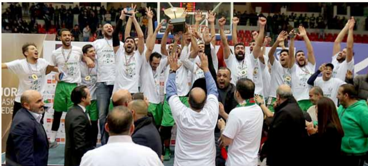
تتويج فريق الوحدات بلقب دوري السلة 2020

لنتميز فصول رواية الألقاب، الوحدانية بالشمولية الرياضية، واستحق معها الوحدات تسميته بـ "سيد الرياضة الأردنية"، وهو الذي جمع المجد من جميع أطرافه، في معادلة تنافسية استعصت على كثير من الأندية بمختلف الرياضات، مضافا سطر جديد إلى سفر أرقامه القياسية في إرشيف الرياضة المحلية، وهو الذي ما يزال يحمل الرقم القياسي بضمه جميع ألقاب الموسم الكروي مرتين، ووسمه "الرباعيات" بوسم الوحدات بمناسبتى ٢٠٠٨ و٢٠١٠، وهو الرقم الذي لم يستطع فريق كروي محلي تخطي حاجزه إلى يومنا هذا.