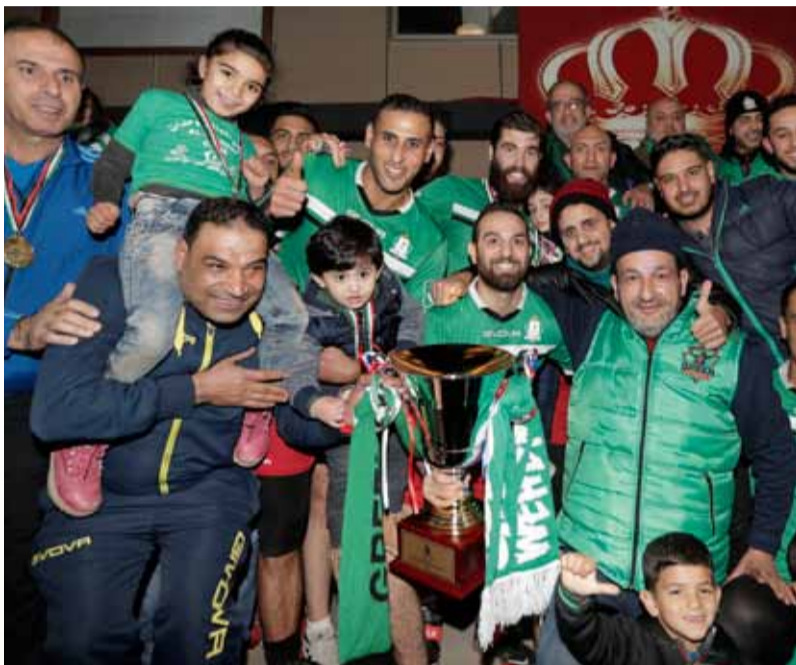
تتويج فريق الوحدات بلقب دوري الكرة الطائرة 2018