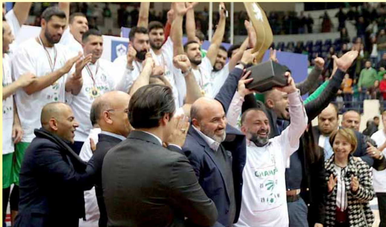
فريق الوحدات الأول بكرة السلة.. استحق اللقب عن جدارة واستحقاق

إنجاز كبير يسجل في تاريخ النادي الوحدات وفي سنة ٢٠٢٠، وأنه ذو قيمة كبيرة لأن المنافسين كانوا على مستوى عالي: الأرتذوكسي والاهلي والجبيلية؛ وهي أندية عريقة قديمة في لعبة السلة، ومع أن الفريق كان متصدر في المرحلة الأولى والثانية إلا