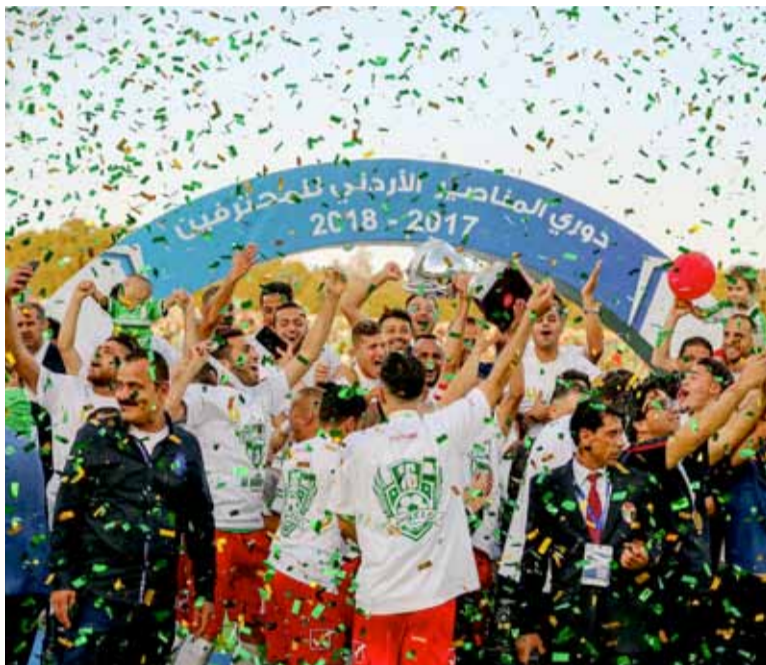
تتويج الوحدات بلقب دوري المحترفين 2017-2018