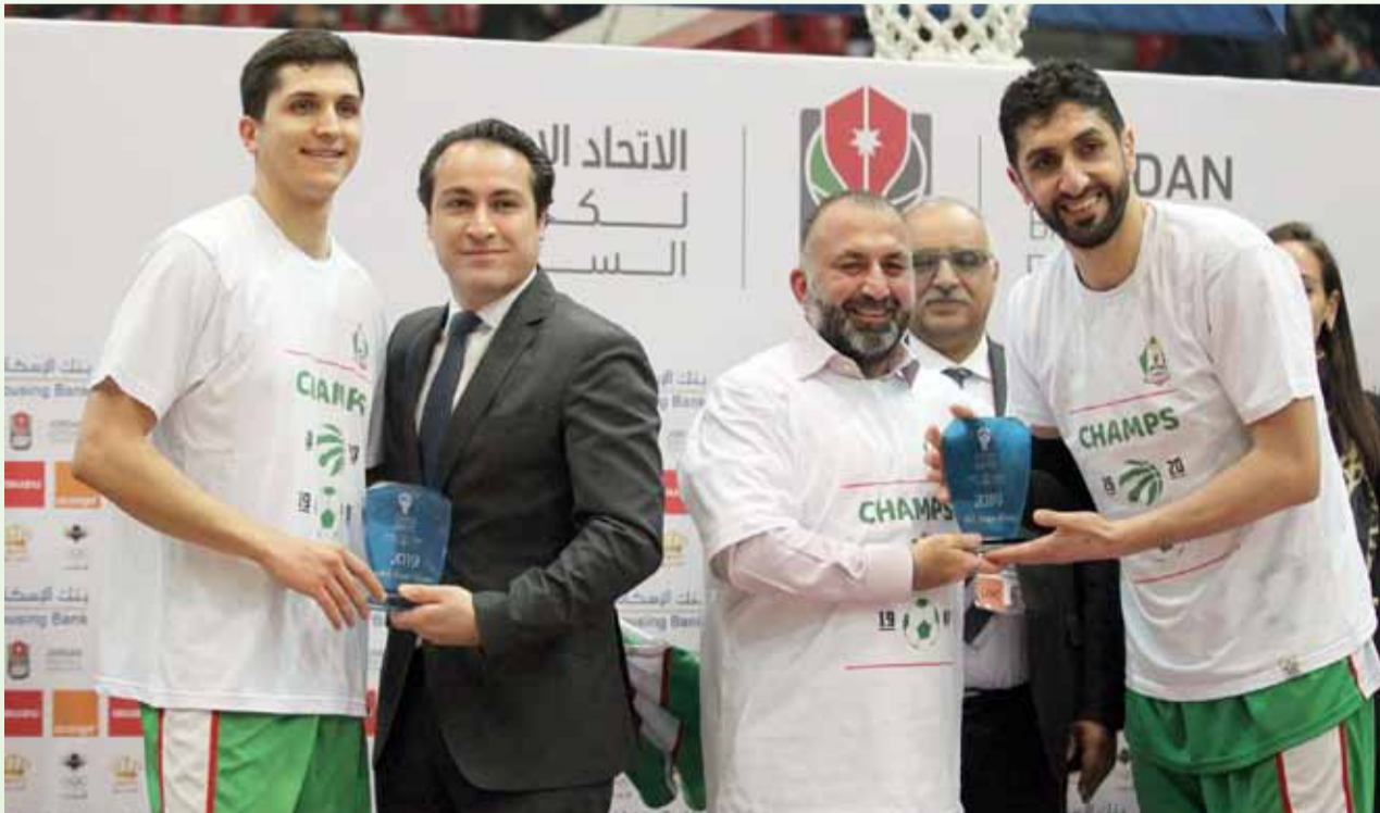
نجوم الوحدات حصود الإنجازات الفردية بشكل لافت