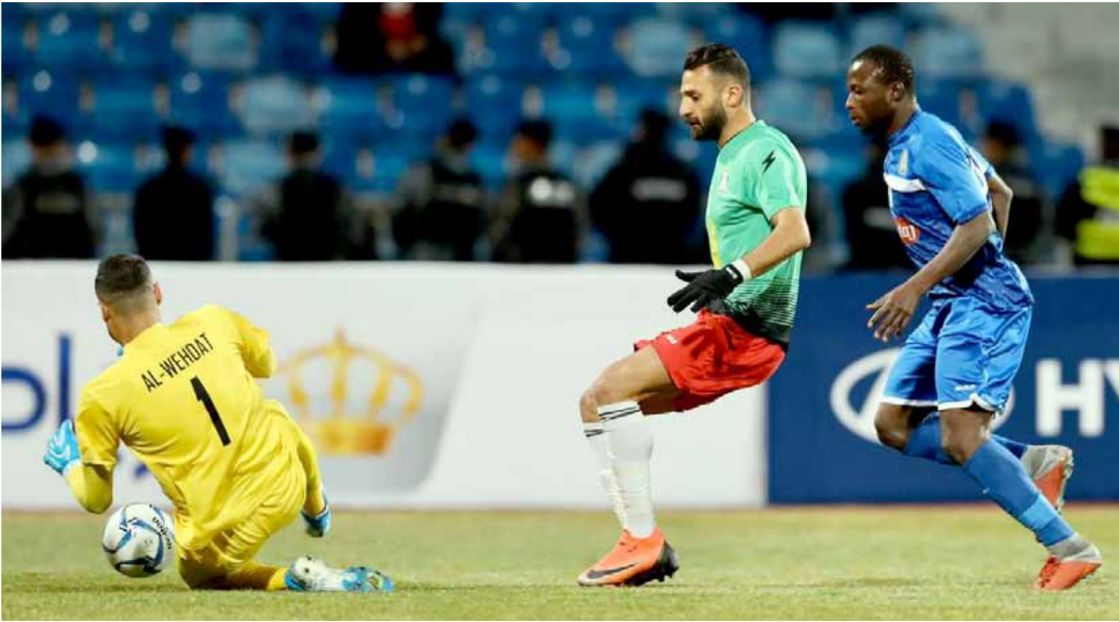
يبن العرب يحجز الكرة من أمام مهاجم سحاب

ويعلم الجهاز الفني للوحدات أن مواجهة السلط هي الأصعب والأكثر خطورة لأن التعادل أو الخسارة ستخرجنا رسمياً من سباق التأهل وتفقدنا اللقب، إلى جانب أنها ستؤثر على ثقة الجماهير قاطبة بالجهاز التدريبي واللاعبين الذين جرى اختيارهم حسب الأصول ودون أي تدخلات تذكر من مجلس إدارة نادي الوحدات الذي منحت الصلاحيات كاملة للكابتن عبدالله أبو زمع ومن يعاونه إيماناً من أصحاب القرار في نادينا بضرورة تلبية الطلبات كافة حتى لا يكون هناك أي عذر مستقبلاً.