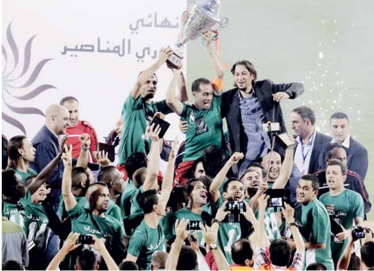
المدير الفني الوطني عبدالله أبو زمع يحمل اللقب 14

موسم 2015-2016، موسم للنسيان وحتى إن كان موسم التكسات إلا أنه حمل اسم الوحدات وهو يتوج باللقب على الرغم من الهزات الكثيرة التي تعرض لها