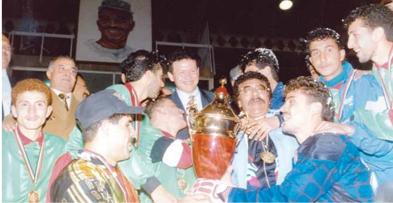
نجوم الوحدات يحتفون بلقب دوري 1995