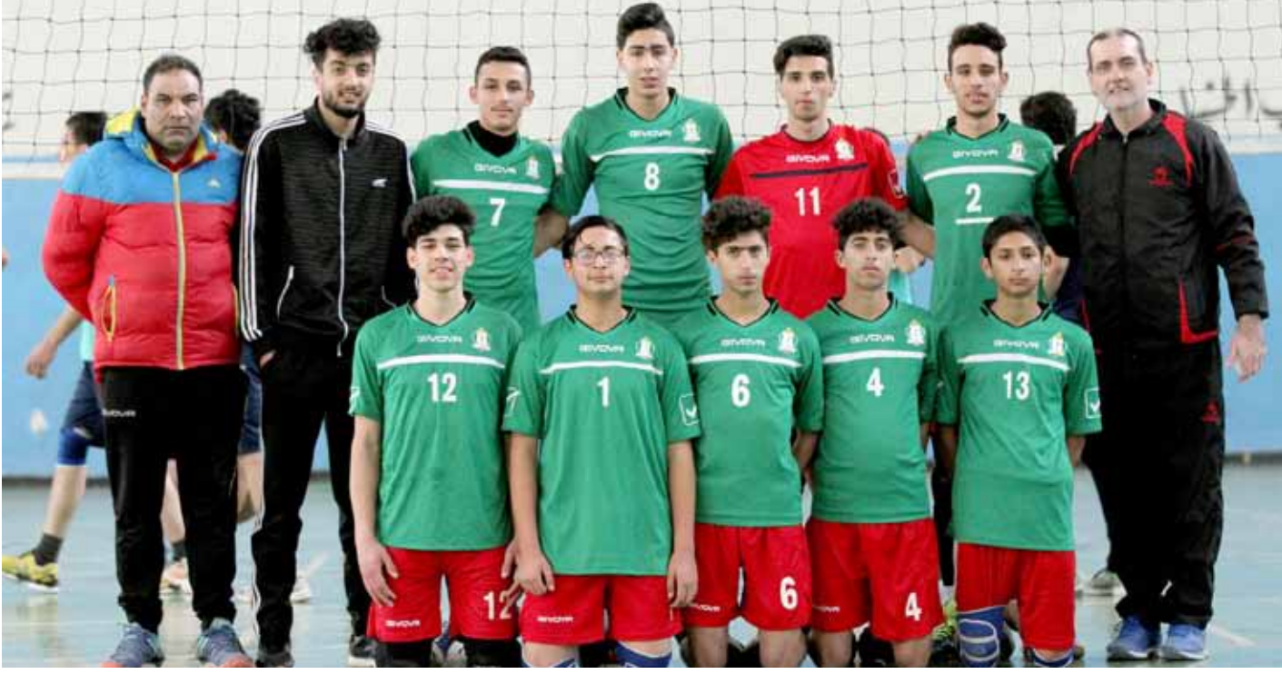
فريق الوحدات الشاب لكرة الطائرة