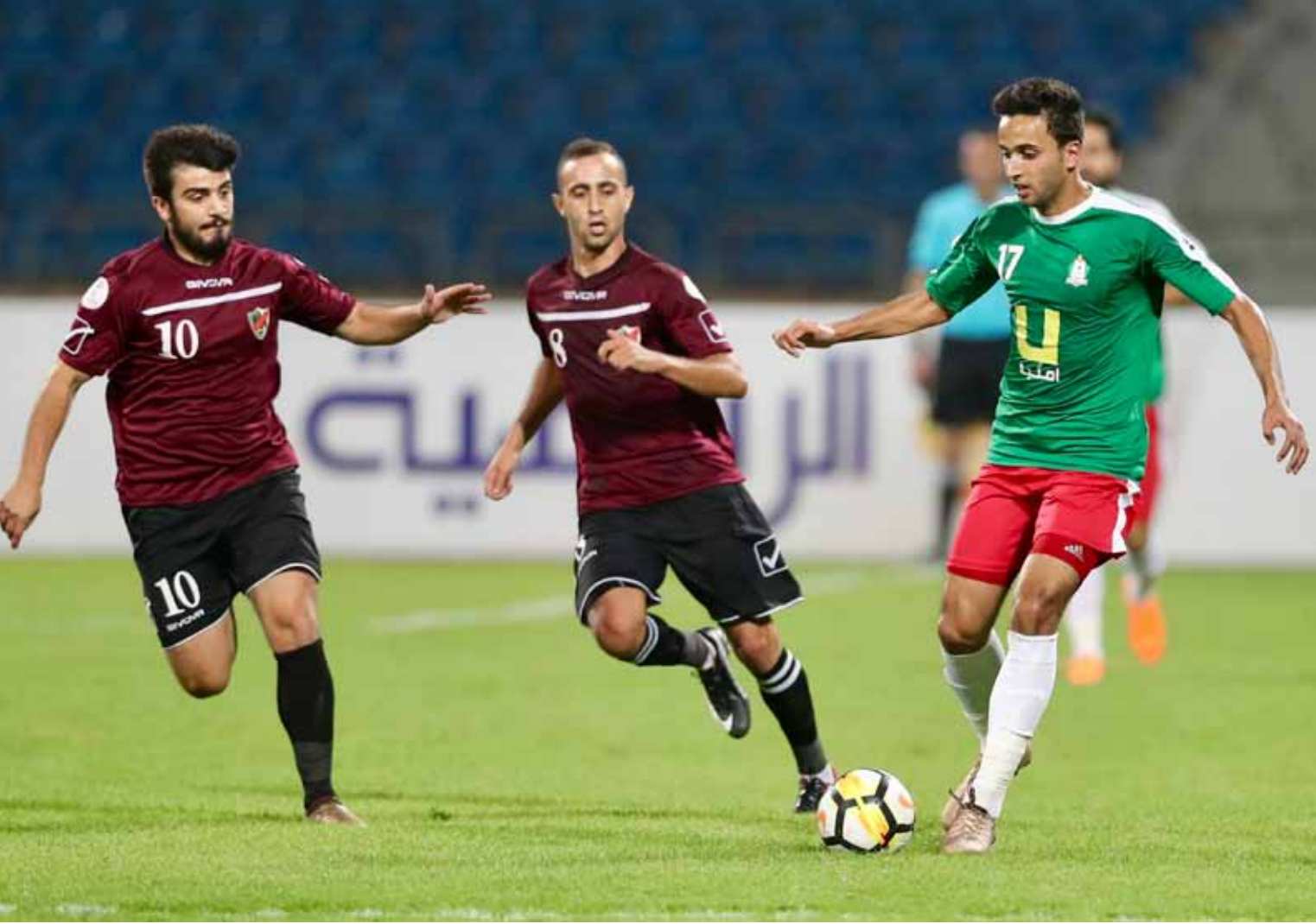
جانب من لقاء الوحدات والأهلي في منافسات دوري المحترفين للموسم الماضي