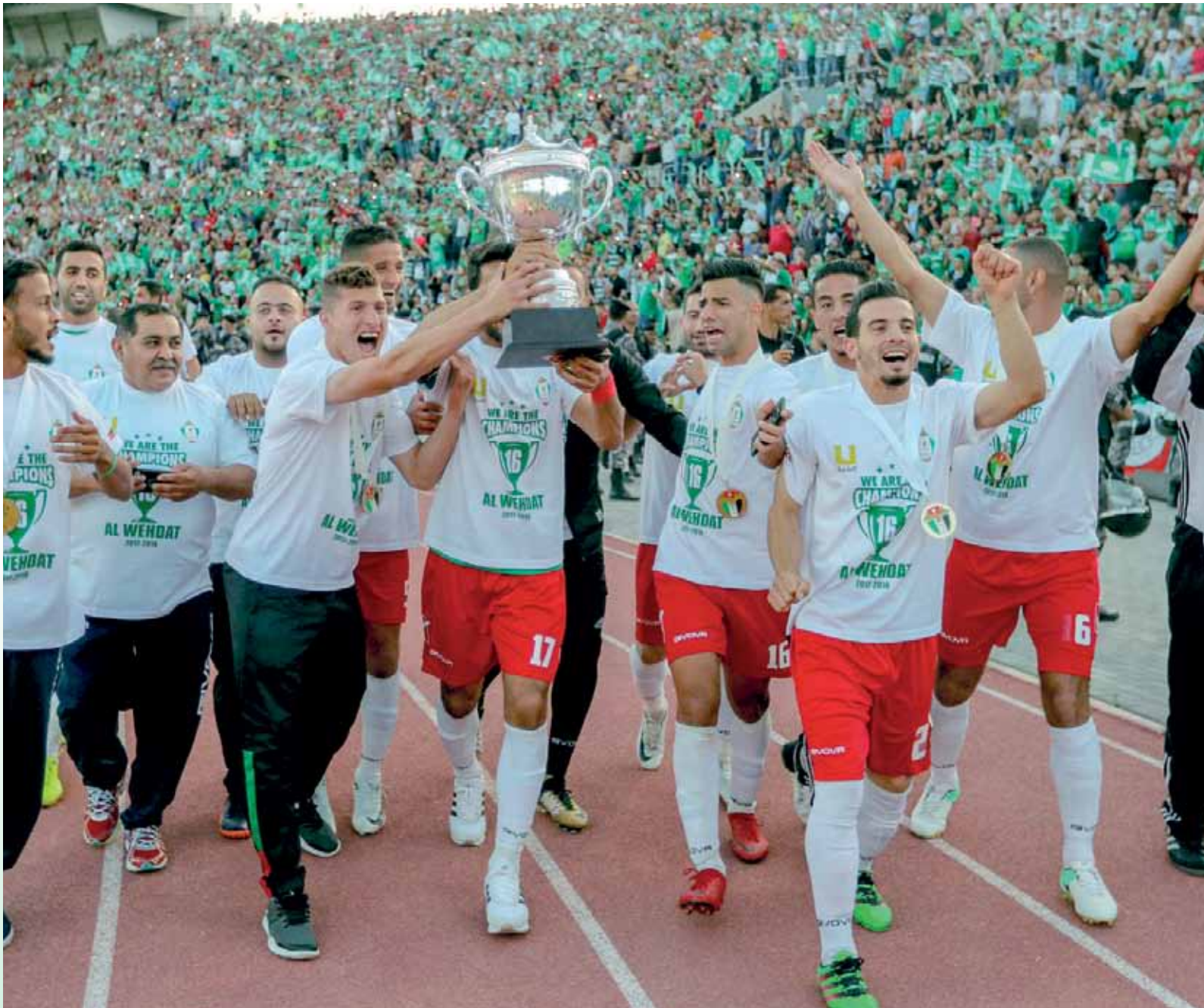
نجوم الوحدات قدموا كأس الدوري 16 لجماهيرهم الوفية