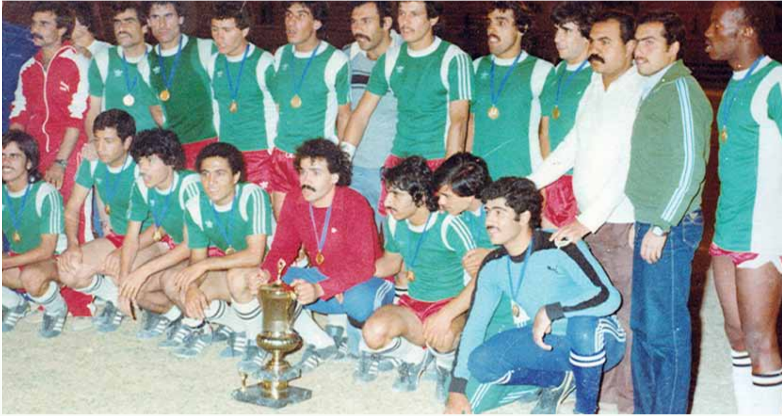
أول لقب للوحدات موسم 1980