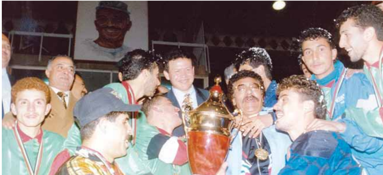
نجوم الوحدات يحتفون بلقب دوري 1995