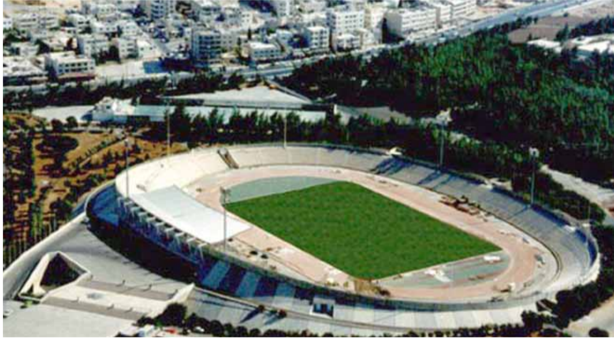
ستاد عمان الدولي

- لم يتم تحديد مواعيد وملاعب مباريات الاسبوع الثاني والعشرون والذي سيقام خلال الفترة من ٢٢ ولغاية ٢٤/١٠/٢٠٢٠، مع الاشارة الى انه سيتم تحديد مواعيد وتوقيتات وملاعب هذه المباريات بعد مراعاة توحيد مواعيد مباريات الفرق التي ستنافس على لقب الدوري او الفرق المهتدة بالهبوط لمصاف اندية الدرجة الاولى.